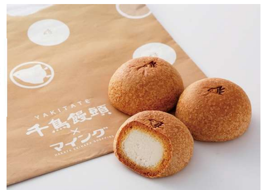
千鳥の刻印がかわいらしいかぼちゃに変わります。